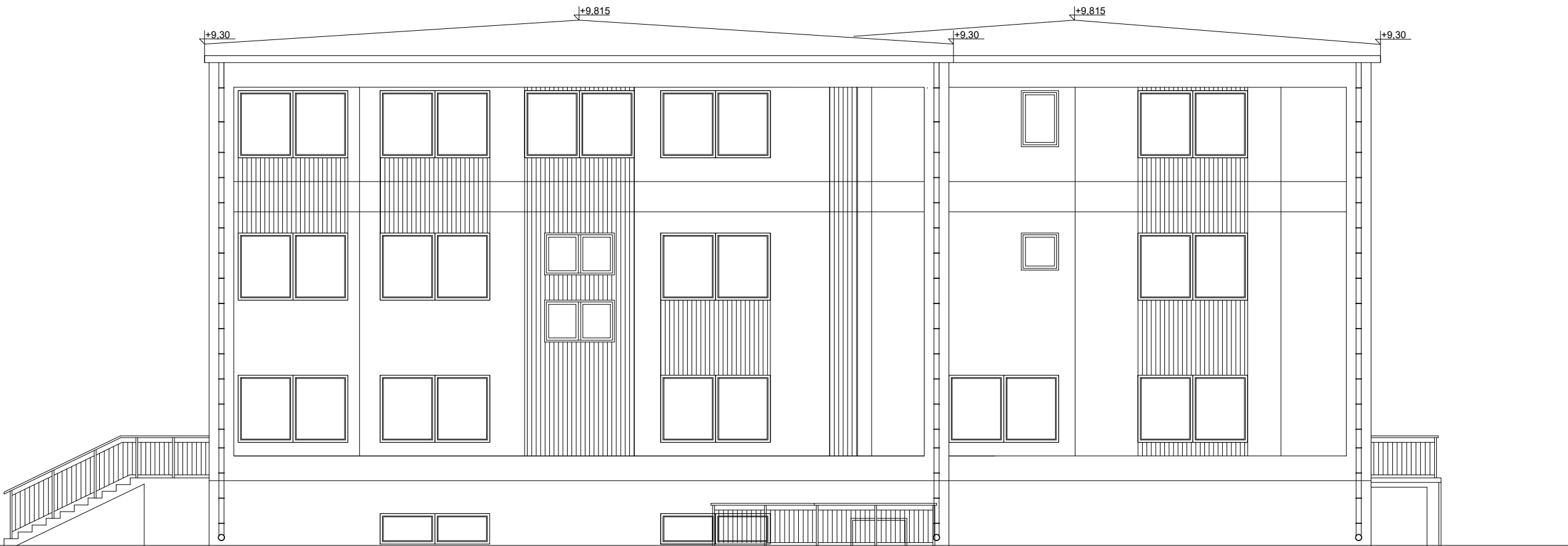
Elewacja tylna - zachodnia