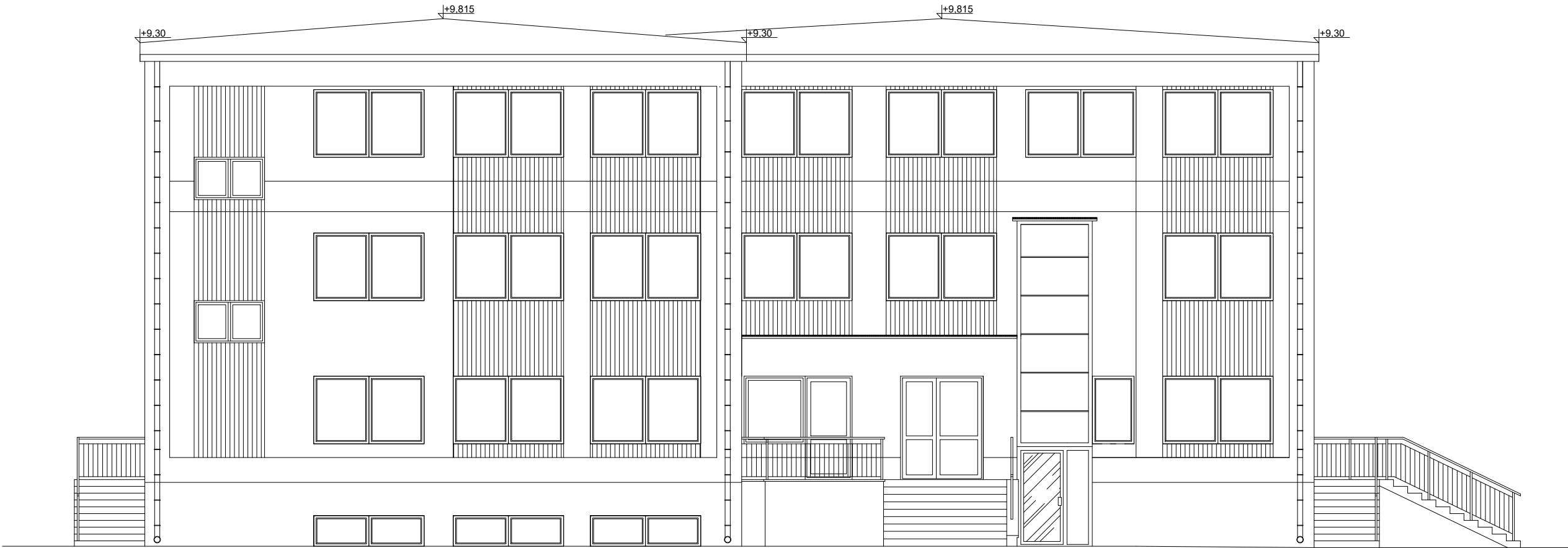
Elewacja frontowa - wschodnia